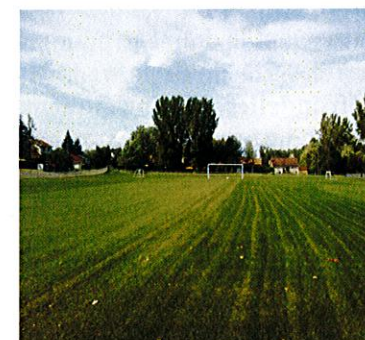
Parc Dorimène-Desjardins, Sorel-Tracy, Québec - 2009

De façon similaire, notre machinerie spécialisée nous permet de façonner et d'apporter une finition selon les normes les plus exigeantes tout en respectant les limites de temps et de budget.